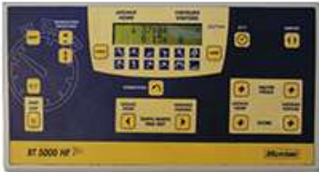
1 CHRONOMETRE DE JEU